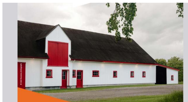
Restauration d'une grange-étable à Saint-Pierre-de-l'Île d'Orléans. Lauréat du Grand Prix de l'Île – Conservation et préservation.

Le Ministère accepte désormais l'octroi de subventions pour les composantes de toiture en tôle déjà peintes en usine lorsque celles-ci sont installées de manière traditionnelle (tôle à baguette, pincée ou à la canadienne). La tôle profilée ne demeure cependant pas acceptable.