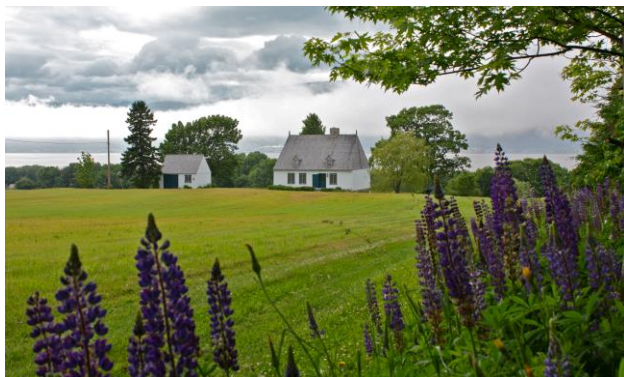
Maison à l'Île d'Orléans.

Des améliorations découlant des échanges avec la MRC et des travaux de la Table ont été apportées au traitement des demandes d'autorisation de travaux. Afin d'améliorer le service client, le MCC a mis en place une étape de recevabilité des dossiers déposés qui permet une rétroaction beaucoup plus rapide auprès des citoyens en vue d'obtenir l'ensemble des documents requis pour l'analyse des dossiers, ce qui a pour effet d'en diminuer le temps de traitement. Ceux-ci reçoivent désormais une confirmation écrite les informant lorsque le dossier est jugé complet et prêt pour analyse.