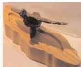
L'oiseau de la fierté , bronze d'Yves Bussières, sculpteur et peintre de Saint-Jean- de-l'Île-d'Orléans

Les œuvres offertes aux lauréats des premiers prix et des grands prix :