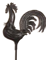
Coq en fer forgé, œuvre de Guy Bel, ferronnier d'art de Saint-Laurent-de- l'Île-d'Orléans