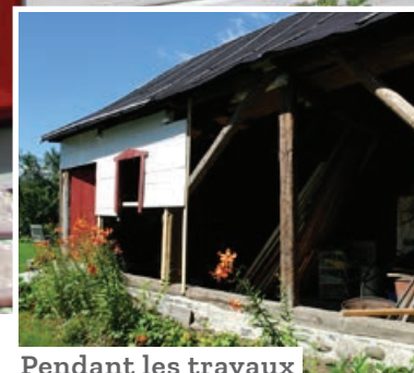
Pendant les travaux